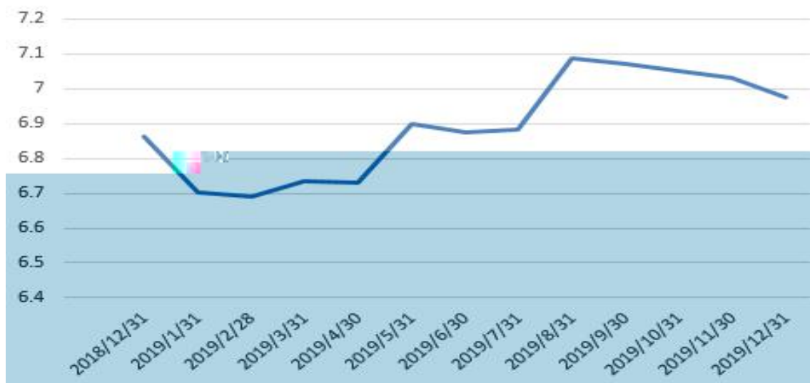
美元兑人民币汇率中间价

上 ，公 业 、 ， 入、 、 、信 减值 ； 、 减值 ， 产减 值 加； 动 ， 务 兑 加。 ， 净利 低于前三 。